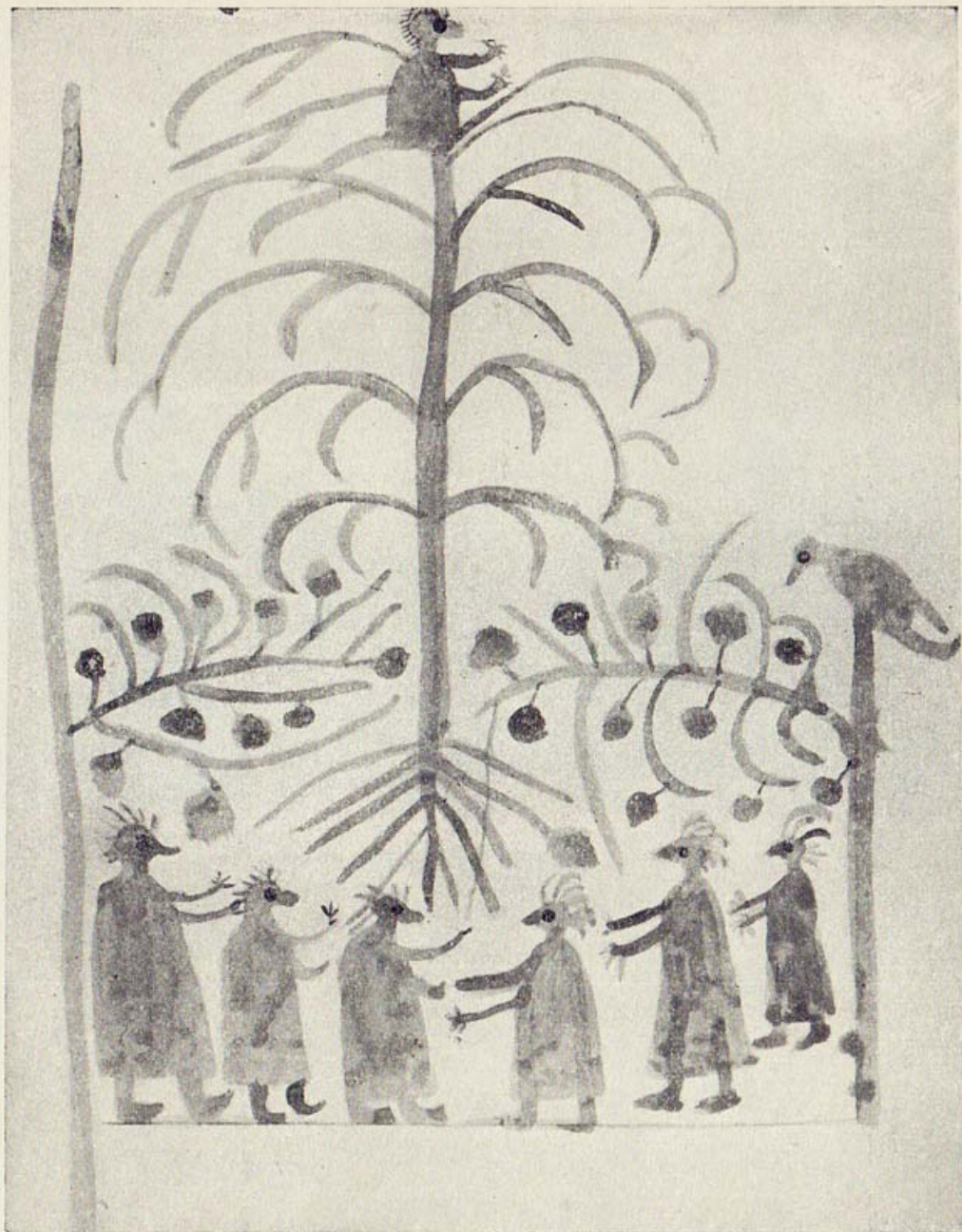
La historia de los ladrones de fruta.