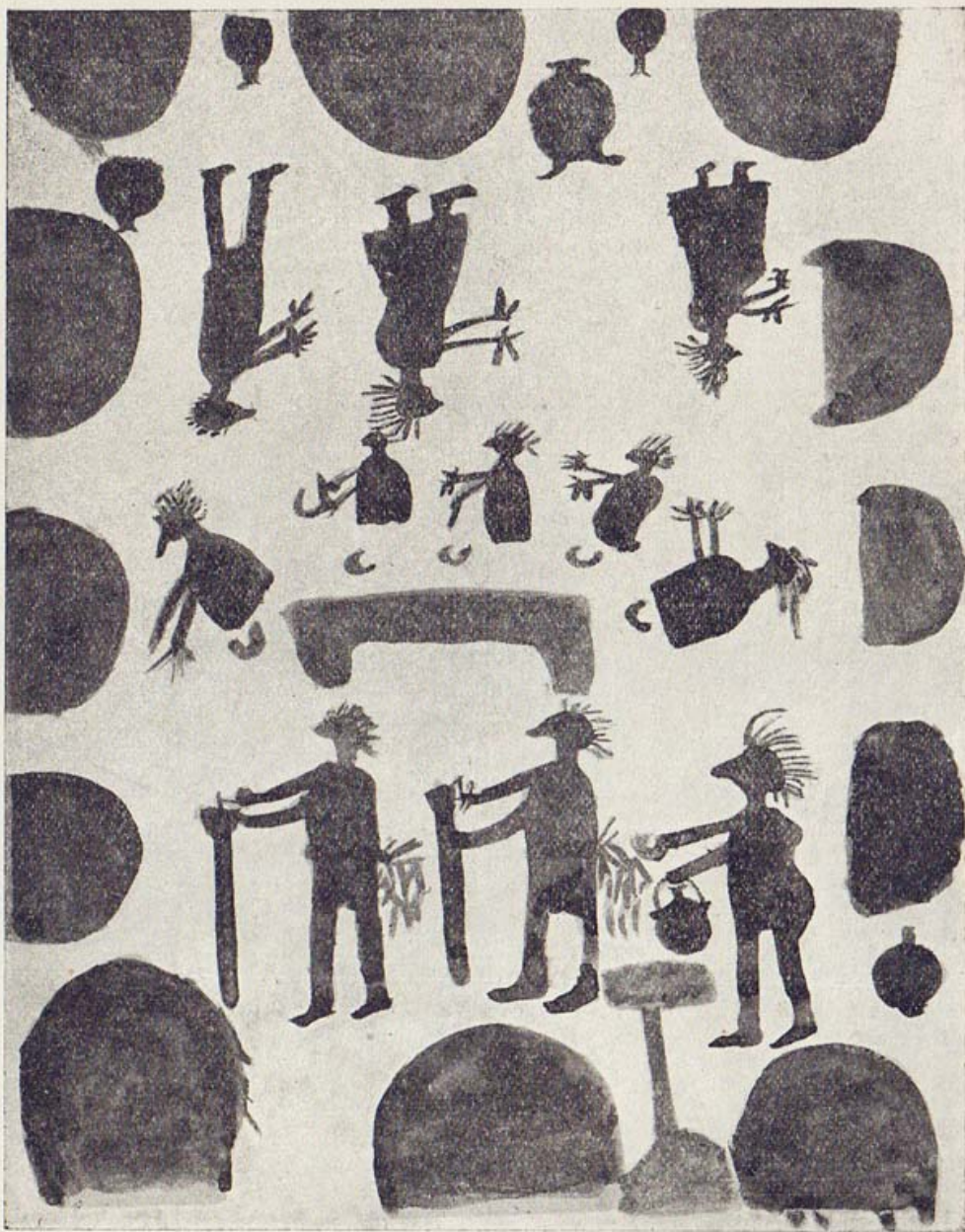
La plaza de la toldería durante una fiesta.