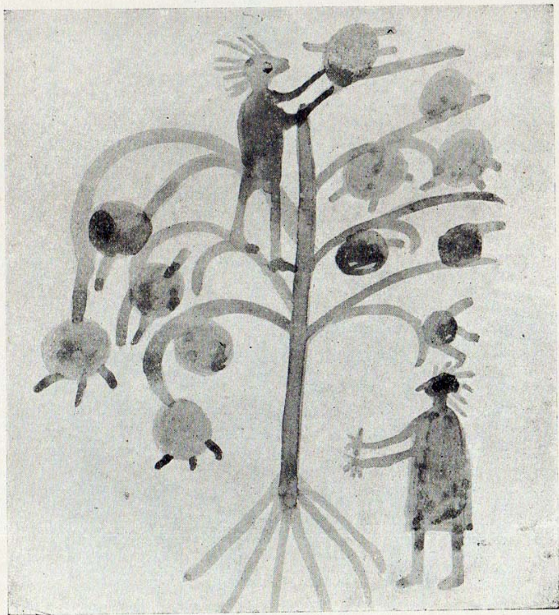
La cacería de pichones.