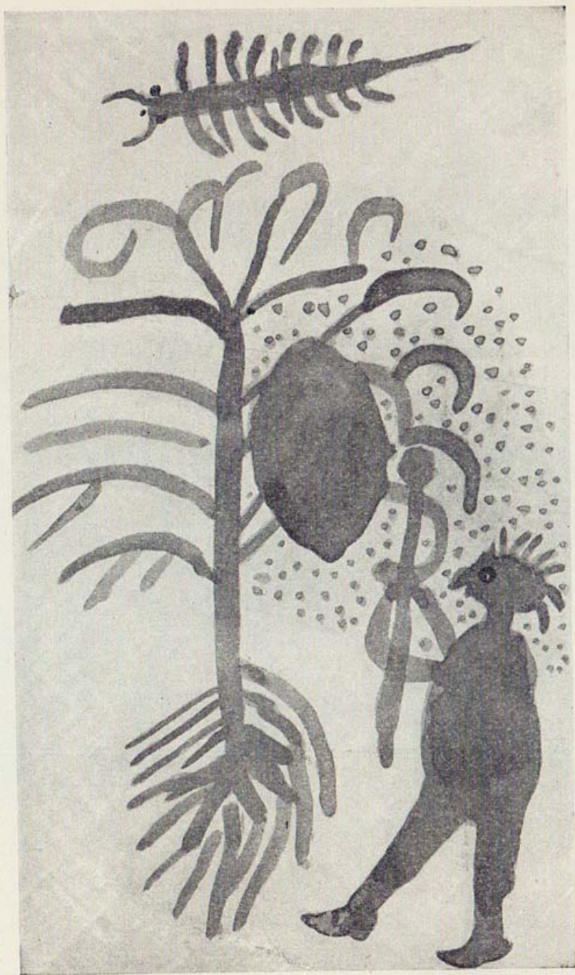
La recolección de miel silvestre.