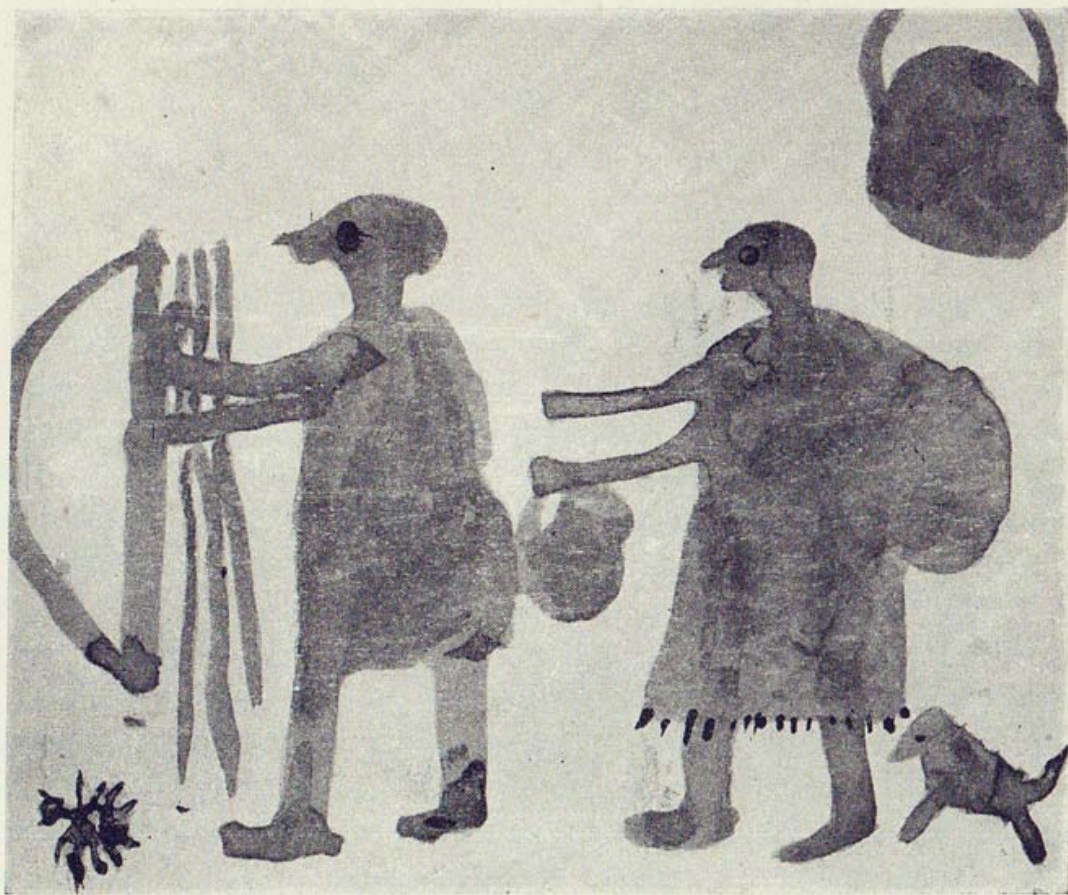
La pareja en marcha.